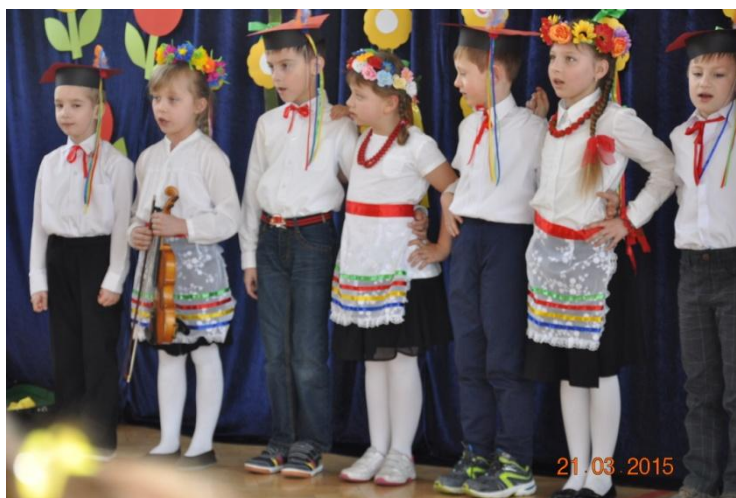
Wykonanie piosenki „Hej na krakowskim rynku”

3. Uczestnicy zajęć Klubu mieli okazję stworzyć mapę myśli związana z wiadomościami o Krakowie – jak się okazało ich wiedza jest bogata.