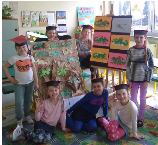
„ Fan club smoka wawelskiego” – smoki wykonane przez uczniów z klasy II i V

2. Uczniowie zapoznali się z legendami o Krakowie. Dzieci poznały również folklor krakowski. Nauczyły się tańczyć krakowiaka, śpiewać piosenki „Hej na krakowskim rynku” oraz „Przyleciał ptaszek z Łobzowa”. Efektem działalności było przedstawienie zaprezentowane podczas powitania wiosny oraz w czasie Dnia Otwartego rodzicom i przybyłym gościom – występy artystyczne uczniów z klasy II. Podczas wymiany międzynarodowej w piękny i prosty sposób uczniowie klasy II nauczyli śpiewać i tańczyć naszych przyjaciół z Poczdamu i Marsali.