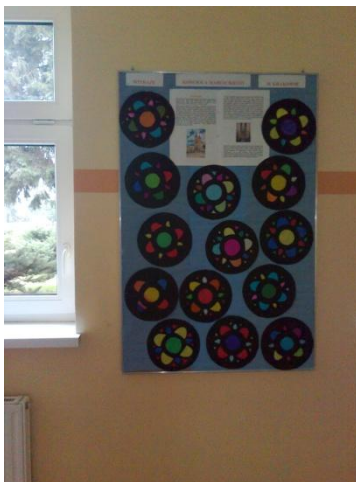
„Witraże kościoła Mariackiego” – klasa II