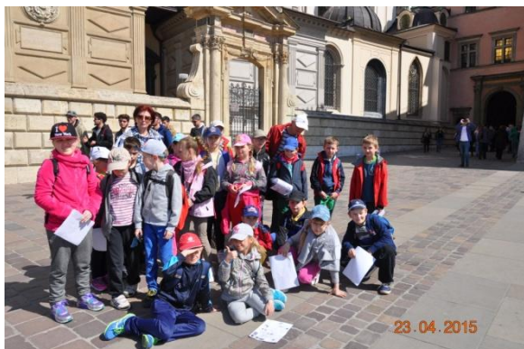
Zwiedzamy Wawelskie Wzgórze