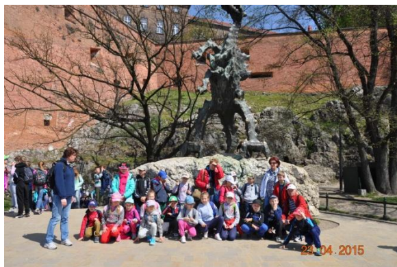
Z wizytą u smoka wawelskiego (jak przystało na fan club)

Rezultatem międzykulturowej działalności naszego szkolnego klubu było podzielenie się myślą o naszym pięknym dziedzictwie narodowym podczas wymiany międzynarodowej w ramach programu Erasmus+. Efektem wzajemnej współpracy będzie kufer muzealny o Krakowie i jego legendach. Podobne kufry powstaną w Poczdamie na temat pałacu Sanssouci i w Marsali na temat Doliny Świątyń w Agrigento na Sycylii.