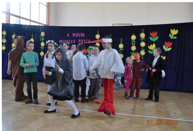
Powitanie wiosny – „Ptaszek z Łobzowa”

2. Uczniowie zapoznali się z legendami o Krakowie. Dzieci poznały również folklor krakowski. Nauczyły się tańczyć krakowiaka, śpiewać piosenki „Hej na krakowskim rynku” oraz „Przyleciał ptaszek z Łobzowa”. Efektem działalności było przedstawienie zaprezentowane podczas powitania wiosny oraz w czasie Dnia Otwartego rodzicom i przybyłym gościom – występy artystyczne uczniów z klasy II. Podczas wymiany międzynarodowej w piękny i prosty sposób uczniowie klasy II nauczyli śpiewać i tańczyć naszych przyjaciół z Poczdamu i Marsali.