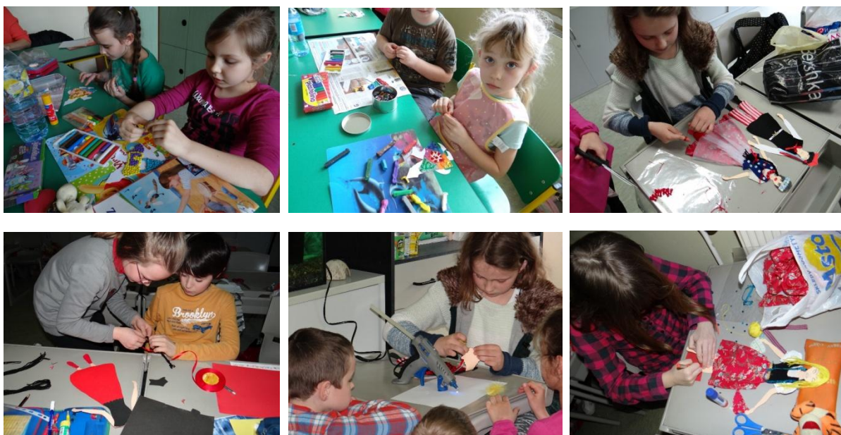
Członkowie klubu podczas zajęć plastycznych