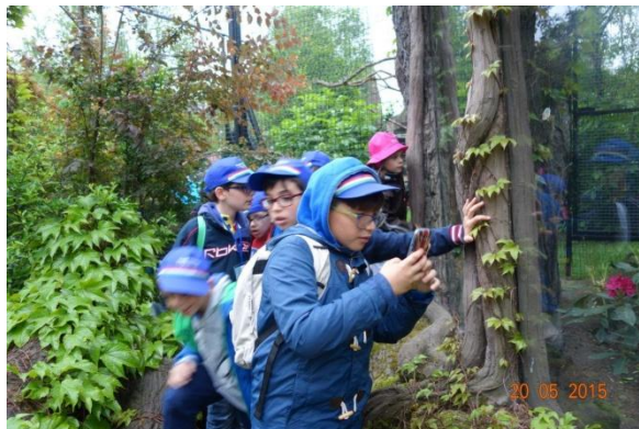
Członkowie Szkolnego Klubu UNESCO Erasmus + z klasy II zaprosili, podczas wymiany w maju tego roku, swoich rówieśników z Sycylii na popołudniowe zwiedzanie opolskiego zoo i wspólną kolację.