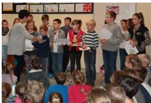
Prezentacja najciekawszych prac konkursowych i wręczenie nagród