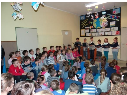
Apel z okazji Powszechnego Dnia Dziecka